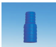
Entlüftungsstutzen / vent connection C1.0605.01