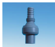
Rückschlagventil mit Entlüftung / non-return- valve with venting 3004.53.00