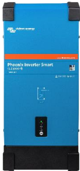
Střídač Phoenix Smart 12/2000