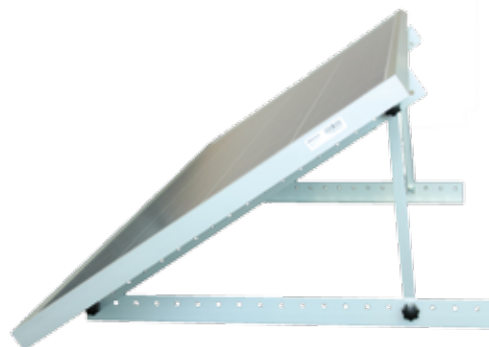
Mono Axial Two