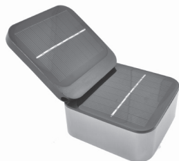
Správne umiestnenie solárnych panelov

Solárne nástenné osvetlenie Kodiak využíva dvojicu inteligentných solárnych panelov pre dosiahnutie najlepšieho výkonu aj pri nedostatočnom slnečnom svite. Predtým než začnete nastavovať dvojicu panelov majte na pamäti, že vrchný solárny panel môže byť len podvihnutý a otočený do určených smerov. Nikdy silou nelaďte na vrchný panel a nesnažte sa ho otočiť tam, kam sa nedá. Mohlo by to spôsobiť poškodenie panela, na čo by sa nevzťahovala záruka. Začnite jemným podvihnutím vrchného solárneho panela, ktorý je prichytený k spodnému panelu. Vrchný panel môže byť podvihnutý a naklonený do 45° uhla. Teraz otočte vrchný panel v smere hodinových ručičiek maximálne do 180° uhla, tak ako požadujete.