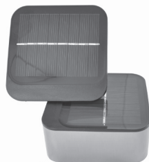
Nesprávne umiestnenie solárnych panelov

Obidva panely by teraz mali byť plne odhalené pre slnečné žiarenie (viď. správne umiestnenie solárnych panelov na obrázku hore). Naklonenie spodného solárneho panela nie je možné. Na dosiahnutie najlepšieho prísunu slnečných lúčov sa môže naklonať vrchný solárny panel, tak ako je popísané vyššie. Nenechávajte vrchný solárny panel v polohe, ktorá by tienila spodnému solárnemu panelu (viď. nesprávne umiestnenie solárnych panelov na obrázku hore.) Ak potrebujete aby bol vrchný panel natočený na iný smer než spodný panel, jemným potiahnutím odstráňte solárne panely z difuzóra, otočte na požadovaný smer a pripevnite naspäť k difuzóru.